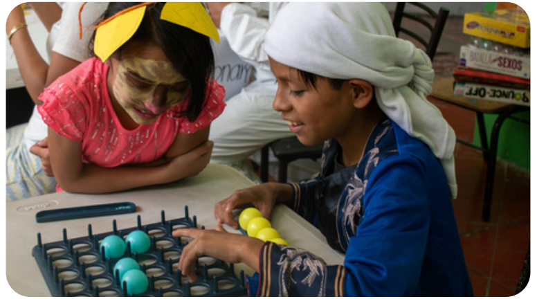
Día del niño