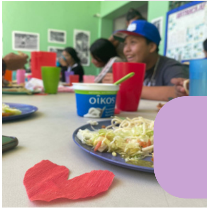
Día del Amor y la Amistad